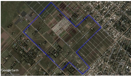
Figura 2. Moncherri, La Matanza, imagen satelital del 2004.