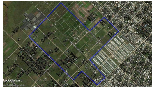
Figura 3. Moncherri, La Matanza, imagen satelital del 2010.

Fuente: Elaboración propia. Soporte: Google Earth