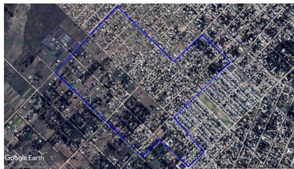
Figura 4. Moncherri, La Matanza, imagen satelital del 2023.

Fuente: Elaboración propia. Soporte: Google Earth