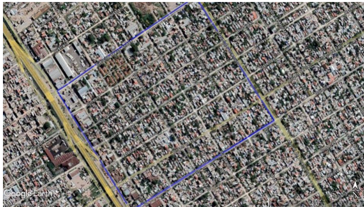
Figura 4. Villa Maipú, Lomas de Zamora, imagen satelital del 2023.