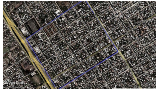
Figura 3. Villa Maipú, Lomas de Zamora, imagen satelital del 2010.